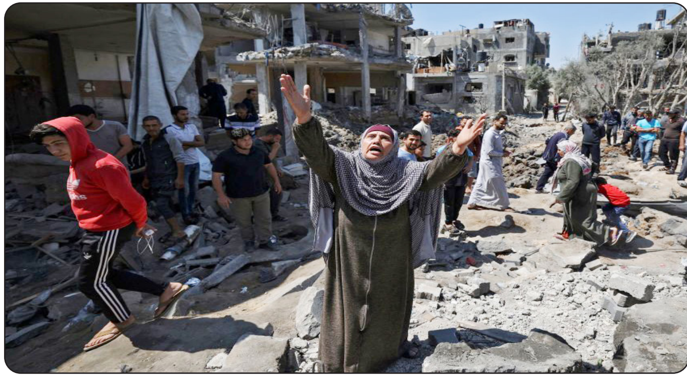
الإسرائيليون المفرج عنهم قبل "نقلهم بالبروكة أو السيارة" إلى مستشفيات في إسرائيل. أما على الجانب الفلسطيني فقد منعت السلطات الإسرائيلية الاحتفال بإطلاق الأسرى الفلسطينيين. واتخذت خطوات لمنع أي مظاهر عامة للفرح بحسب بيان رسمي صدر الجمعة. وهذا وسيطلق سراح 33 محتجزاً إسرائيلياً في المرحلة الأولى من الاتفاق التي تمتد 42 يوماً. إذ سيطلق في اليوم الأول أي

مع ترقب دخول اتفاق وقف إطلاق النار في غزة وتبادل الأسرى بين حركة حماس والعدو الإسرائيلي، حيز التنفيذ اليوم الأحد، بدأت الاستعدادات لاستقبال الأسرى، وفيما أعلنت وزارة العدل الإسرائيلية أنه سيتم الإفراج عن 737 أسيراً فلسطينياً مقابل إطلاق سراح أول دفعة من المحتجزين الإسرائيليين، وذلك في إطار المرحلة الأولى من اتفاق تبادل الأسرى ووقف إطلاق النار في قطاع غزة، أفادت هيئة بث العدو الإسرائيلية امس السبت بأن الحكومة وافقت على صفقة التبادل ووقف إطلاق النار في غزة. فقد حضرت إسرائيل نقاط تسلّم عند معبر كرم أبو سالم (أقصى جنوب شرقي قطاع غزة)، وقاعدة رعيم (خارج قطاع غزة شرق دير البلح)، ومعبر "إيرز" (معبر بيت حانون شمالي القطاع)، حيث سيعاين أطباء وأخصائيون نفسيون