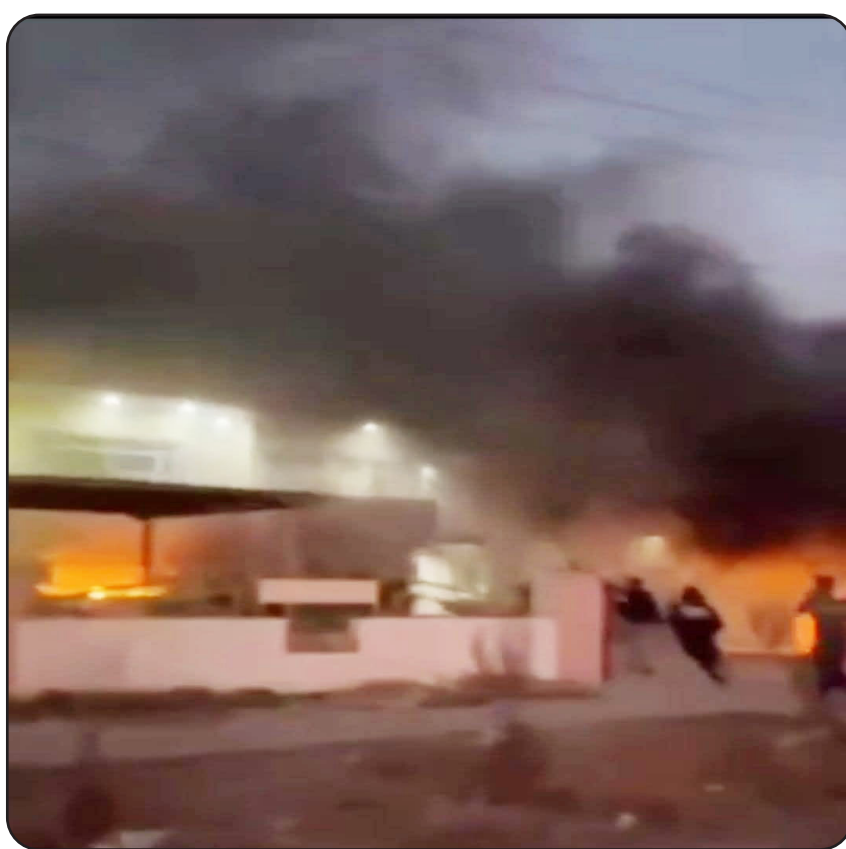
الاثنين، استتالة شالو بعد مسيرة امتدت نحو 49 عاماً داخل صفوف علي عسكري. وجاء ذلك

أربيل / متابعة صوت القلم: وتناقل ناشطون على التواصل الاجتماعي مقطع فيديو يظهر فيها قيام مجموعة من أبناء العشيرة وهم يقومون بحرق المقر الهركي وقوات البيشمرجة، في القضاء. فيما اقدم مواطنون من عشيرة الهركي، امس الاثنين، على حرق مقر الحزب الديمقراطي الكردستاني في قضاء خبات باربيل. وقال مصدر، إن اشتباكات عنيفة اندلعت مساء امس الاثنين بين عشيرة الهركي وقوات البيشمرجة بقضاء خبات في محافظة أربيل. واقدام مواطنون من عشيرة الهركي، على حرق مقر الحزب الديمقراطي الكردستاني في قضاء خبات باربيل.