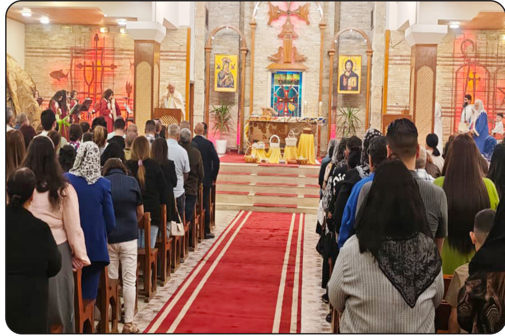
قيماً إنسانية سامية، في مقدمتها وهي مبادئ نحرص جميعاً على مجتمعنا». المحبة والتسامح والتآخي، ترسيخها وتعزيز حضورها في وتابع، أنه «بهذه المناسبة،

وهناً رئيس الجمهورية، عبد اللطيف جمال رشيد، المسيحيين بمناسبة عيد القيامة المجيد. وقال عبد اللطيف في تدويته على منصة (X): «أطيب التبريكات إلى أبناء شعبنا من المسيحيين في العراق ومختلف أنحاء العالم، بمناسبة عيد القيامة المجيد، متمنين أن تعود هذه المناسبة المباركة على الجميع بالخير والسلام والطمأنينة.» وأضاف أن «هذا العيد يجسد