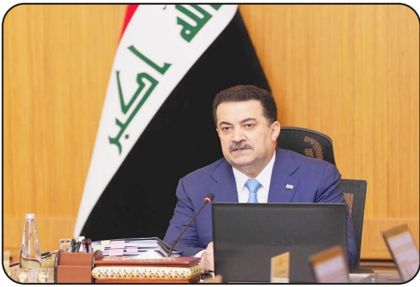
بغداد / صوت القلم:

وقال مكتبه الإعلامي في بيان: إن «رئيس مجلس الوزراء محمد شياع السوداني ترأس، امس الأربعاء، اجتماع الهيئة العليا للتنسيق بين المحافظات».