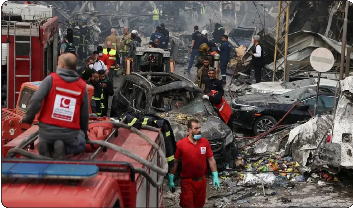
بيروت / متابعة صوت القلم:

بغداد / صوت القلم: وجه وزير الداخلية عبد الأمير الشمري، الفرق الفنية والجناحية بسرعة إنجاز تقاريرها بشأن حادثي العامرية وشارع فلسطين ببغداد. وذكرت الوزارة في بيان: أن «وزير الداخلية عبد الأمير الشمري، أجرى زيارة ميدانية ليلية لموقعي الحادثين اللذين استهدفا منطقتي العامرية وشارع فلسطين في العاصمة بغداد مساء الثلاثاء، إثر سقوط مقذوفات وقصف جوي».