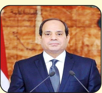
القاهرة / متابعة صوت القلم:

الأولى من صباح امس إعلان التوصل لاتفاق وقف إطلاق النار بين الولايات المتحدة الأمريكية والجمهورية الإسلامية الإيرانية، وهو خبر بلا شك أثلج صدور الملايين من محبي السلام في سائر بقاع الأرض، وأدعو الله - عز وجل - أن