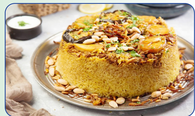
المقادير : الدجاج: دجاجتان (منظفتان) (مقطع إلى ومقطعتان) الأرز: 3 اكواب (منقوع في ماء الجزر: 1 حبة (مقطع)