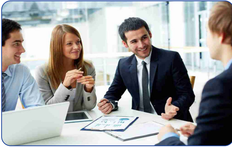
الضحك وسيلة طبيعية وفعالة للحفاظ على الصحة، دون الحاجة إلى تدخلات المناعي، مما يجعل الجسم أكثر قدرة على مقاومة الأمراض. هذه الفوائد تجعل من

في ظل الضغوط المتزايدة التي يواجهها الإنسان في حياته اليومية، قد يبدو الضحك أمراً بسيطاً أو لحظة عابرة لا تستحق التوقف عندها، لكنه في الحقيقة يُعد من أقوى الوسائل الطبيعية التي تؤثر بشكل إيجابي على الصحة الجسدية والنفسية. فالضحك ليس مجرد تعبير عن الفرح، بل هو استجابة متكاملة يشارك فيها العقل والجسم، وتنعكس آثارها على الحالة العامة للإنسان بشكل ملحوظ. ومع تكرار هذه اللحظات، يمكن أن يتحول الضحك إلى أسلوب حياة يُسهم في تحسين جودة الحياة بشكل عام. التأثير الجسدي للضحك على صحة الإنسان عندما يضحك الإنسان، يبدأ جسمه