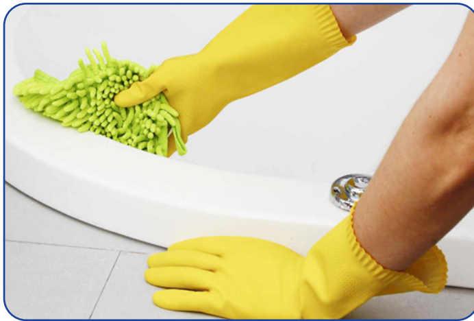
أن تقوم بعمل عجينة من صودا الخبز مع الماء أو صودا الخبز مع الخل وتقوم بعمل عجينة وتفرك بها الصابون المتراكم بقوة. 2- إزالة البقع من التواليت والحوض إن الحفاظ على التواليت والحوض

إن تنظيف دورة المياه يعتبر امراً هاماً جداً وهذا يرجع إلى أن الحمام مكان تنمو فيه الجراثيم والفيليات الضارة ولذلك نكون في حاجة الى تنظيف الحمام بصفة دائمة ومستمرة ولكن في بعض الأوقات قد تجد صعوبة في تنظيف الحمام بدون استخدام المواد الكيميائية التي قد تضر الجلد وقد تضر أيضاً اجزاء الحمام المختلفة ولذلك فإننا من خلال هذه المقالة سوف نرشدك إلى كيفية تنظيف الحمام بطرق طبيعية بعيداً عن الكيماويات: 1- التخلص من رواسب الصابون